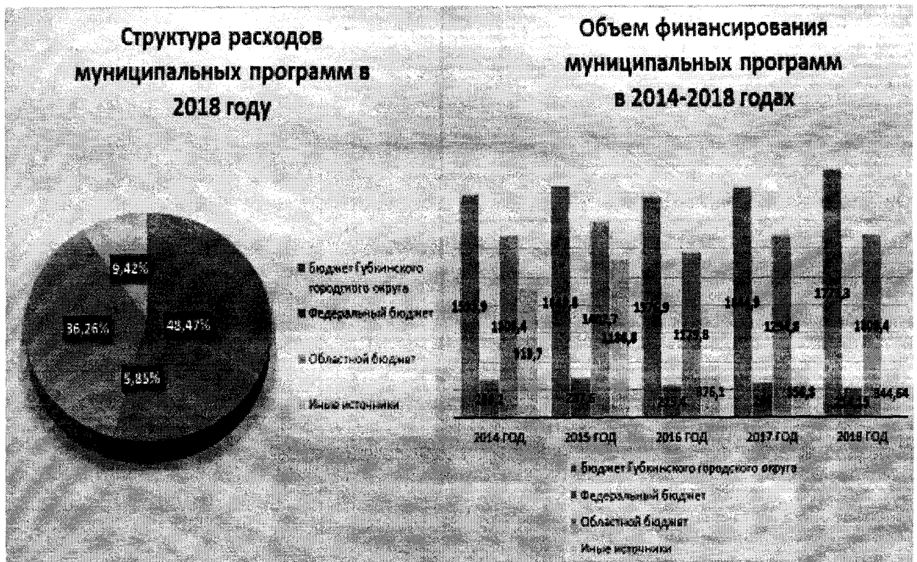
Рис.3 Ресурсное обеспечение муниципальных программ