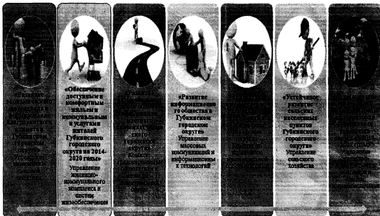
Рис.1 Ведомственная принадлежность муниципальных программ Губкинского городского округа

Оценка эффективности реализации муниципальных программ проведена в соответствии с Порядком, установленным постановлением администрации Губкинского городского округа от 06 июня 2013 года № 1335-па «Об утверждении порядка принятия решений о разработке муниципальных программ Губкинского городского округа, их формирования, реализации и оценки эффективности» (с последующими редакциями) на основании отчетов, представленных ответственными исполнителями муниципальных программ по четырем критериям: достижение показателей конечного результата, достижение показателей непосредственного результата, освоение средств бюджета Губкинского городского округа и реализация проектов (приложение №1).